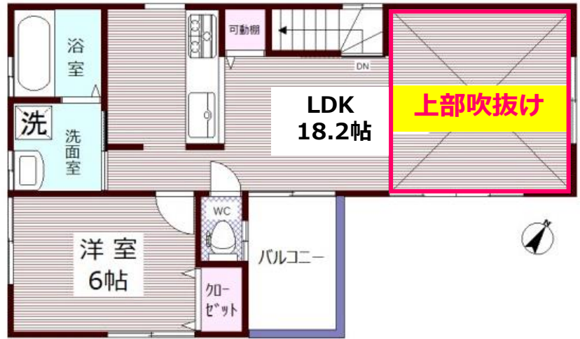
【 2F 】