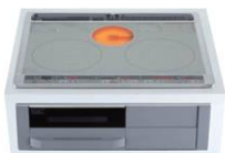
高火力、高性能な IHクッキングヒーター